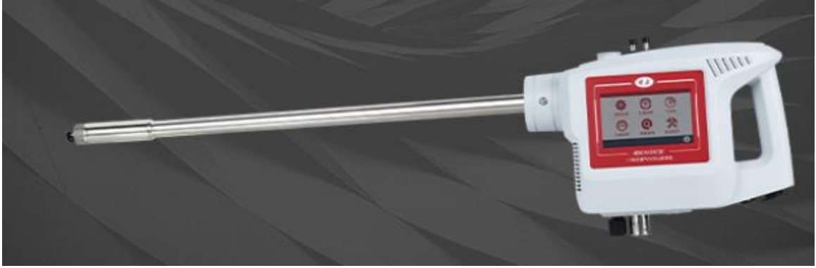
图3 试验采用器类型

为了保障企业的权益，测试数据相关的仪器型号和厂家采用隐去名称采用代号的形式进行处理。