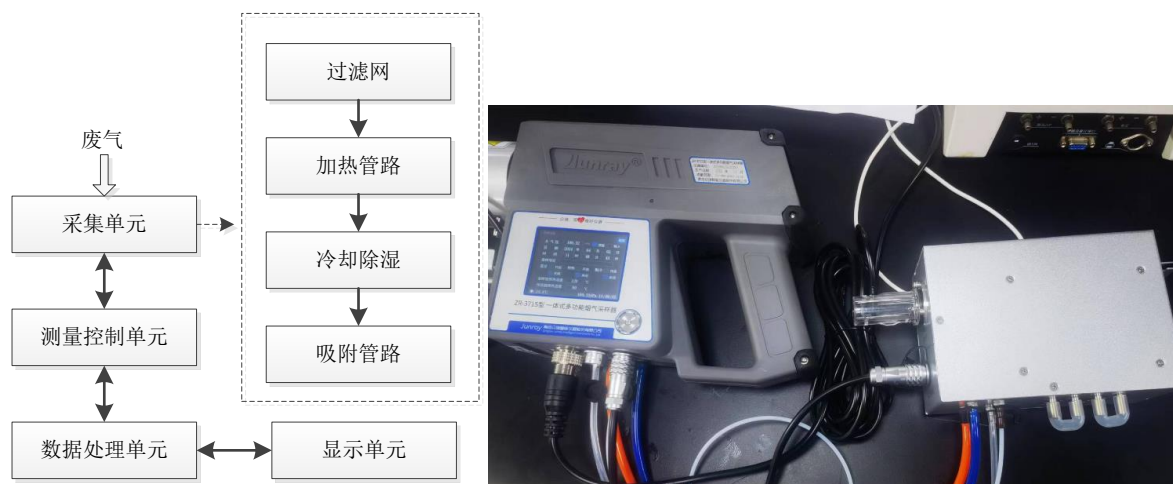
图 2 便携式废气VOCs采样器结构及原理图