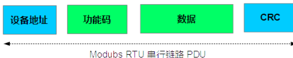
图 3 Modbus RTU 串行链路 PDU