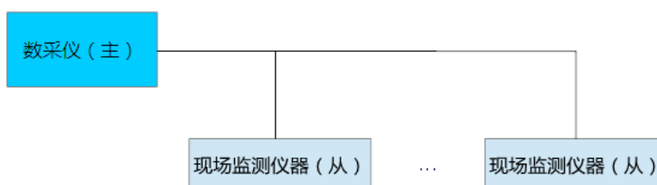
图 1 Modbus 主从通信系统结构

在线监测仪器与数采仪之间通信协议采用 Modbus RTU 标准，数采仪作为 Modbus 主机，每台在线监测仪器作为 Modbus 从机。